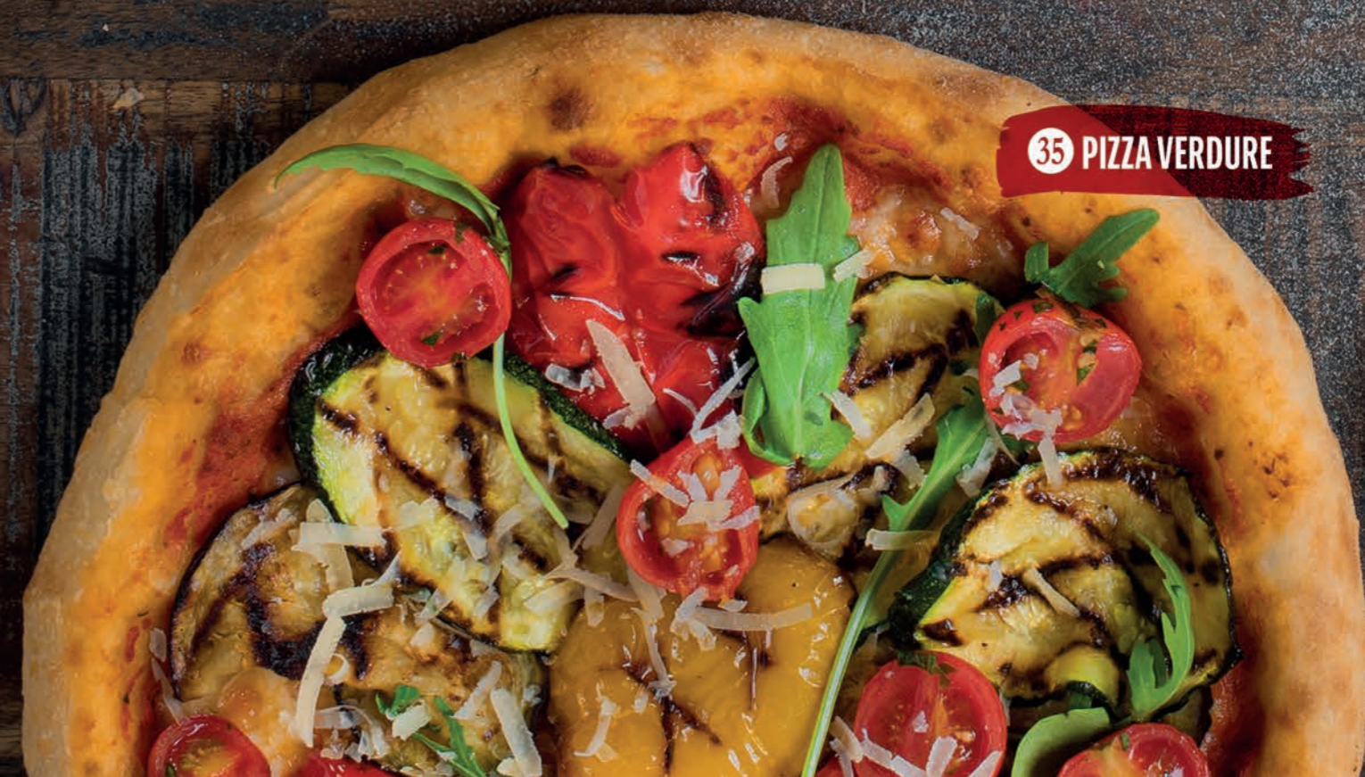
35 PIZZA VERDURE