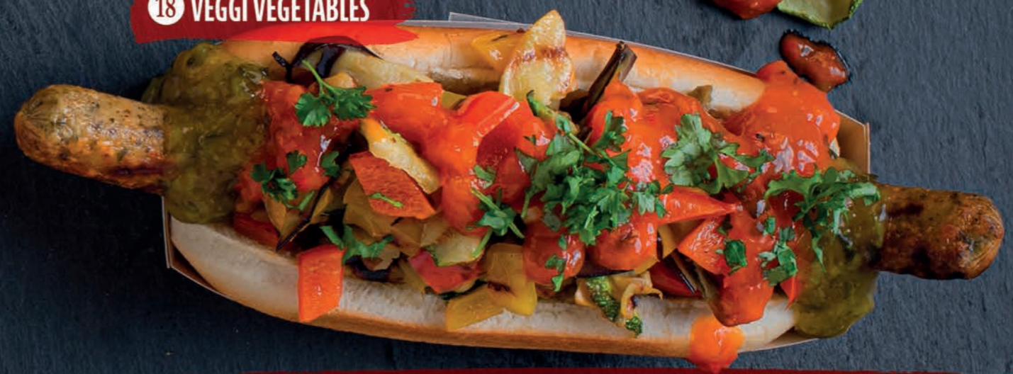
18 VEGGIE VEGETABLES