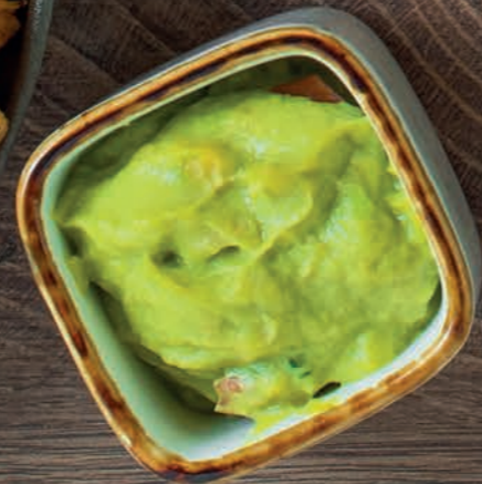
23 NACHOS CHICKEN CHEESE