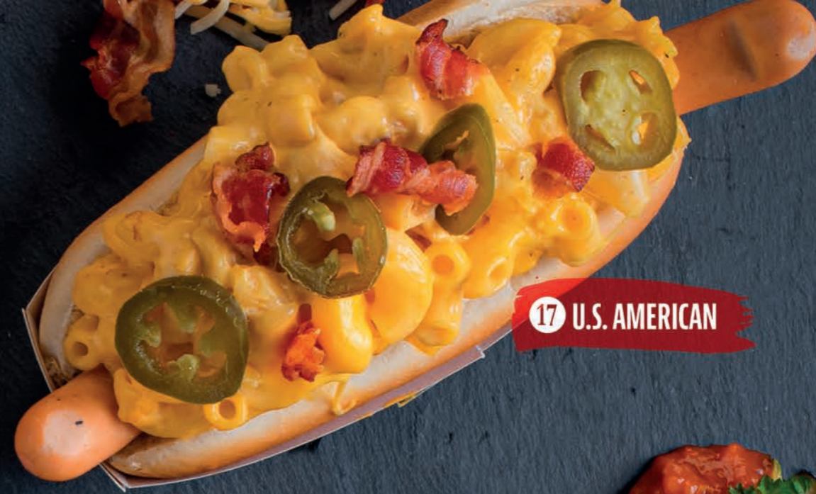
17 U.S. AMERICAN