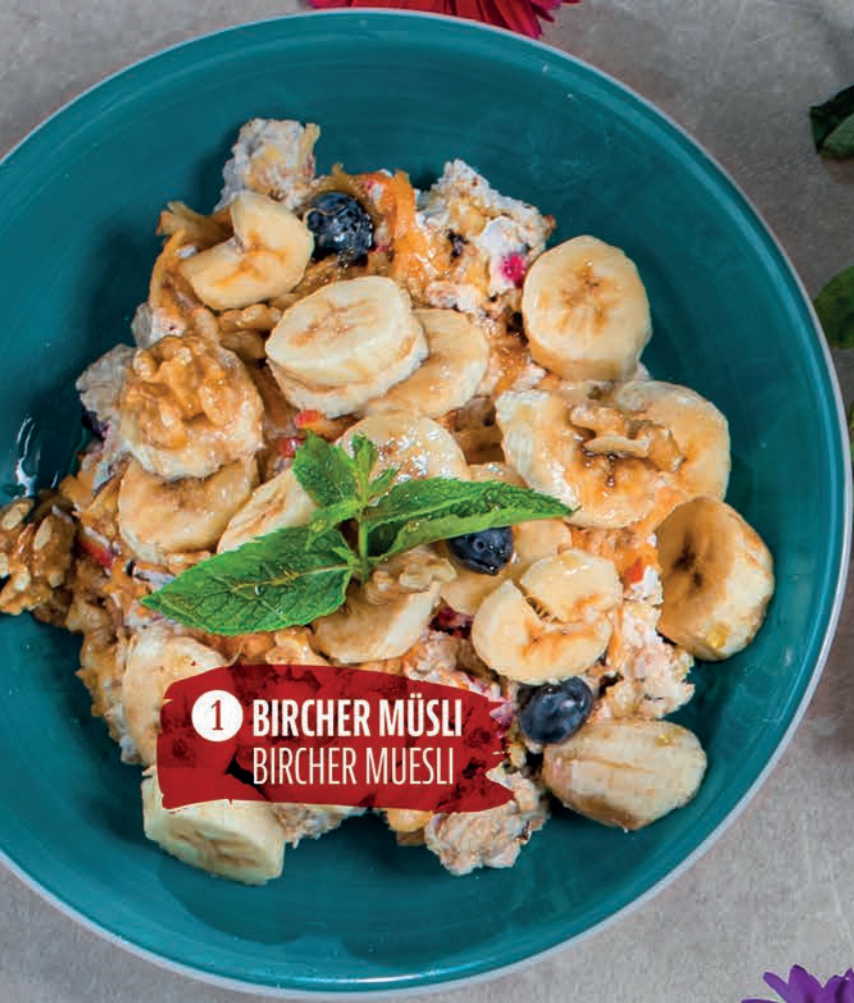
1 BIRCHER MÜSLI BIRCHER MUESLI