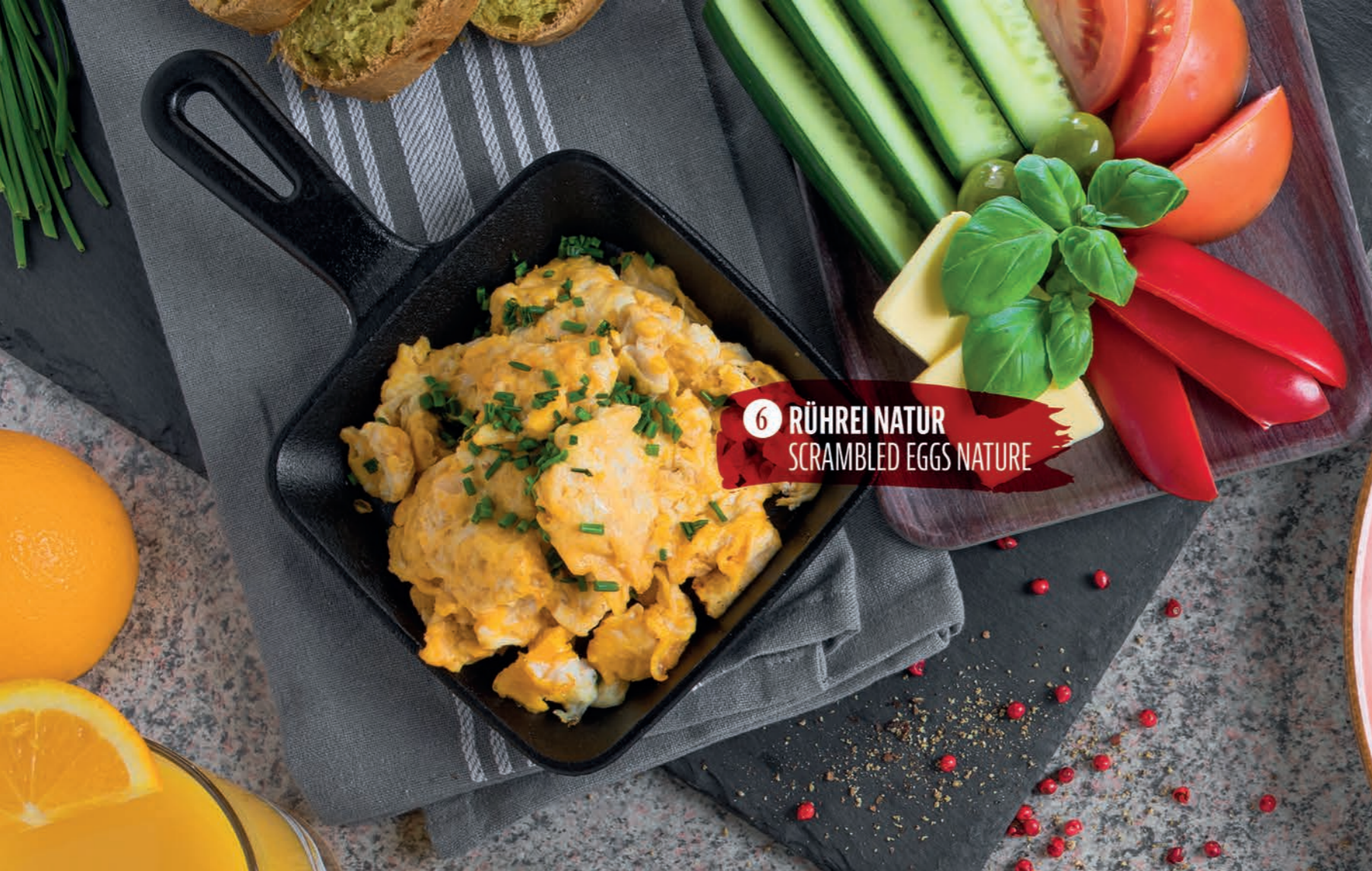
6 RÜHREI NATUR SCRAMBLED EGGS NATURE