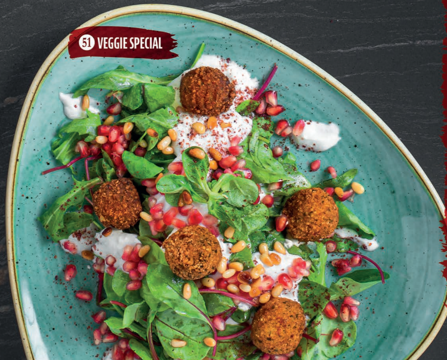
51 VEGGIE SPECIAL