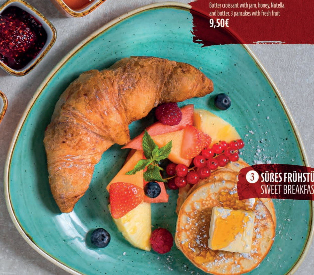
3 SÜßES FRÜHSTÜCK SWEET BREAKFAST