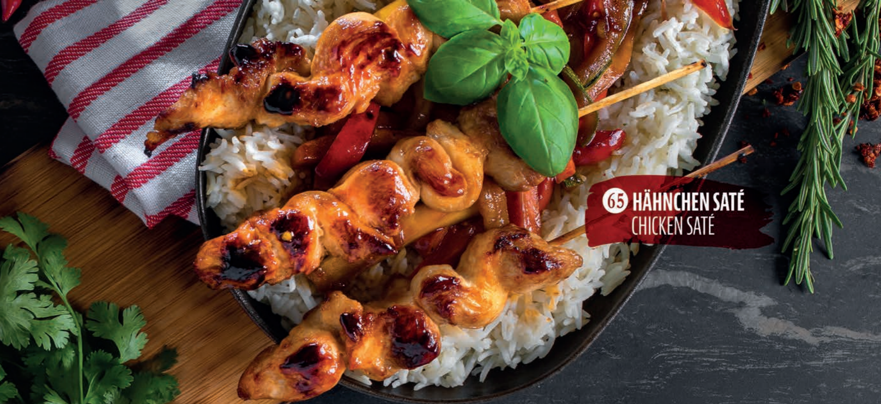
65 HÄHNCHEN SATÉ CHICKEN SATÉ