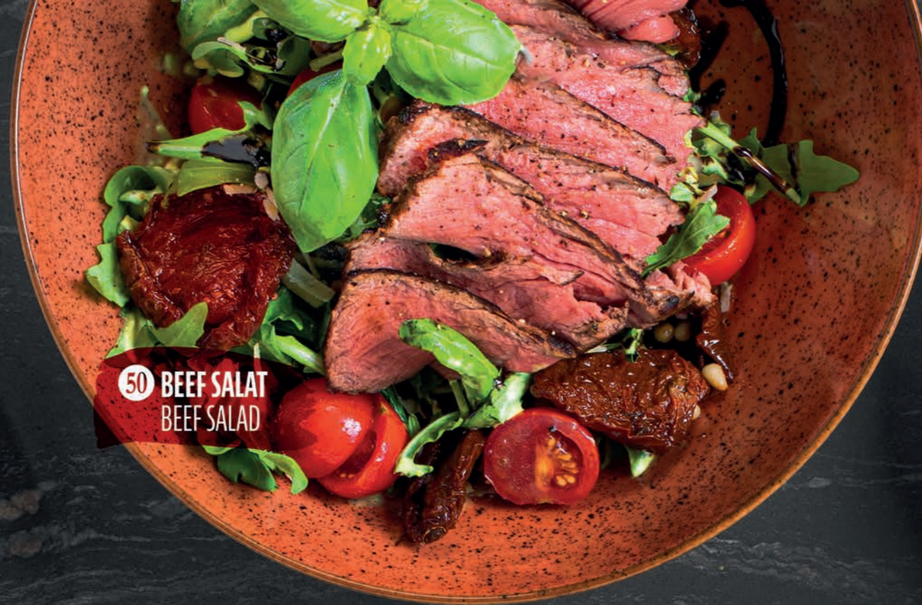
50 BEEF SALAT BEEF SALAD