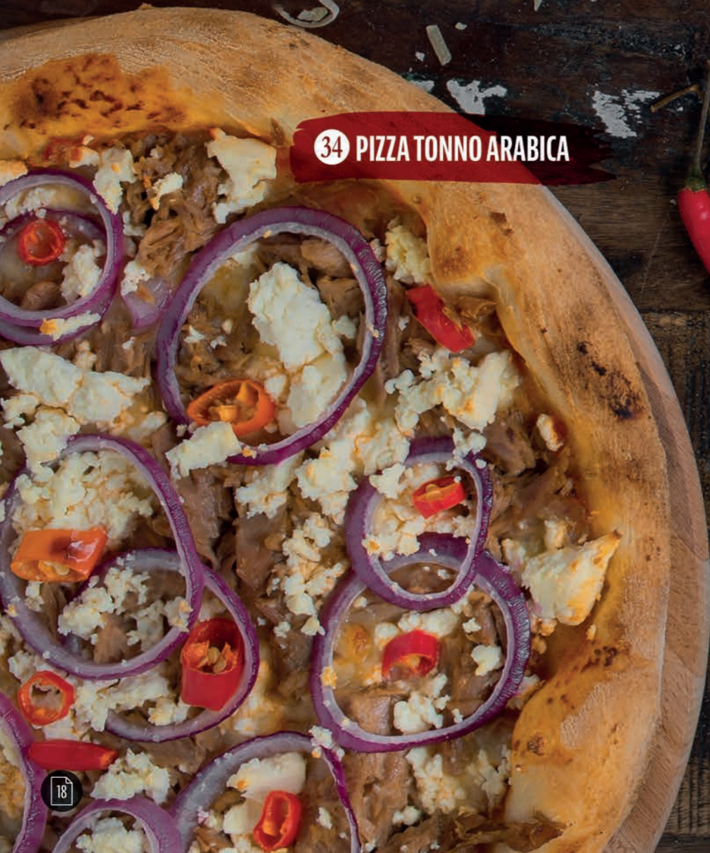
34 PIZZA TONNO ARABICA