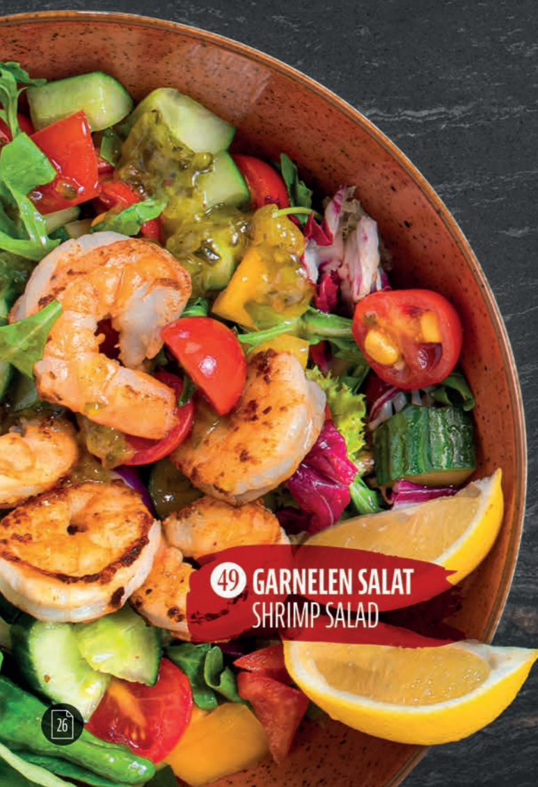
49 GARNELEN SALAT SHRIMP SALAD