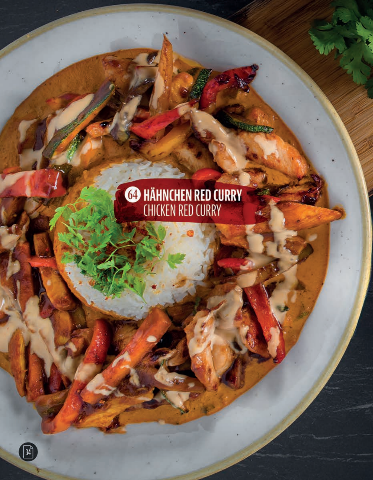
64 HÄHNCHEN RED CURRY CHICKEN RED CURRY