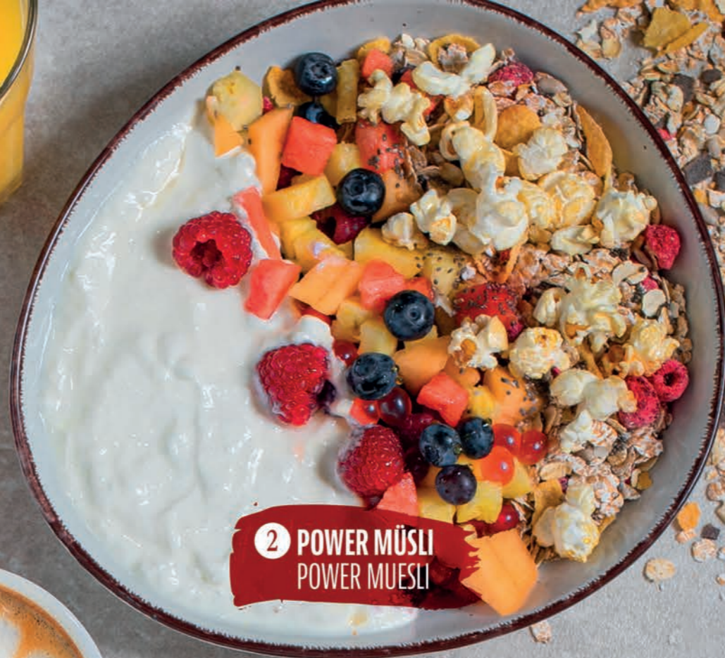
2 POWER MÜSLI POWER MUESLI