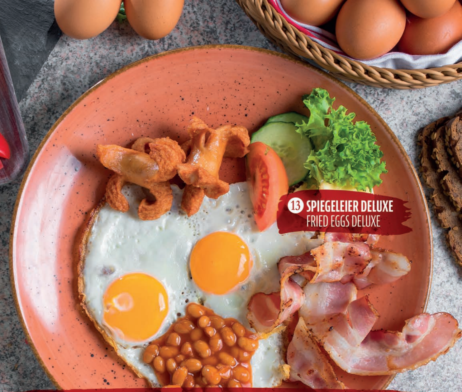
13 SPIEGELEIER DELUXE FRIED EGGS DELUXE