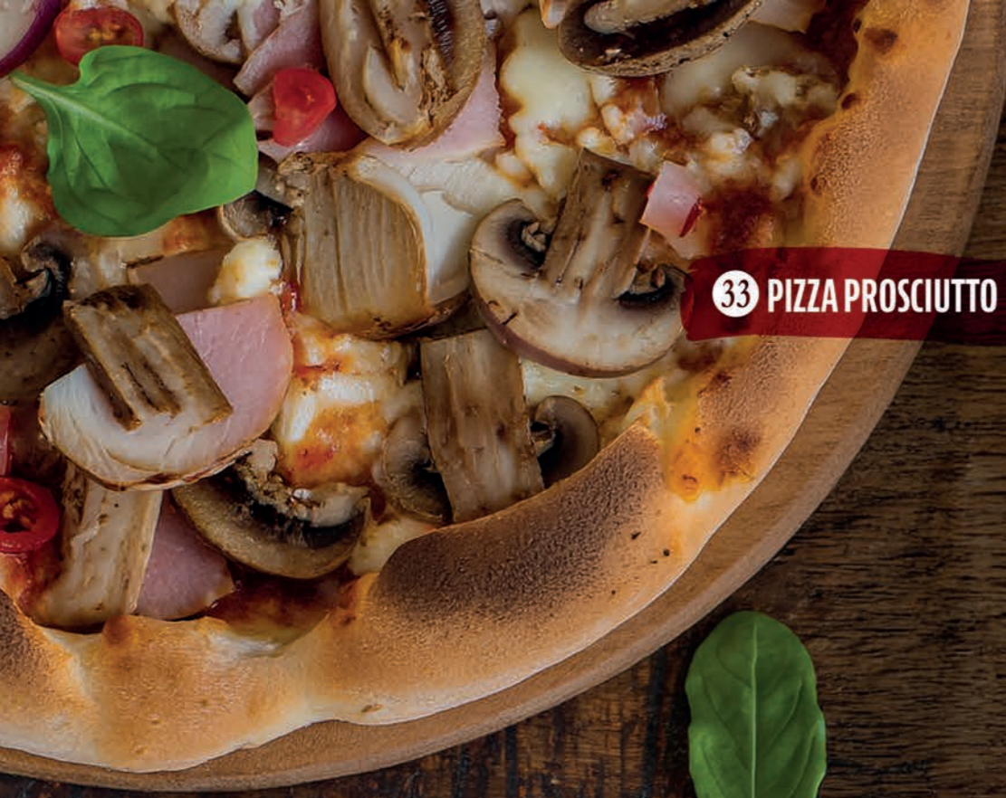
33 PIZZA PROSCIUTTO