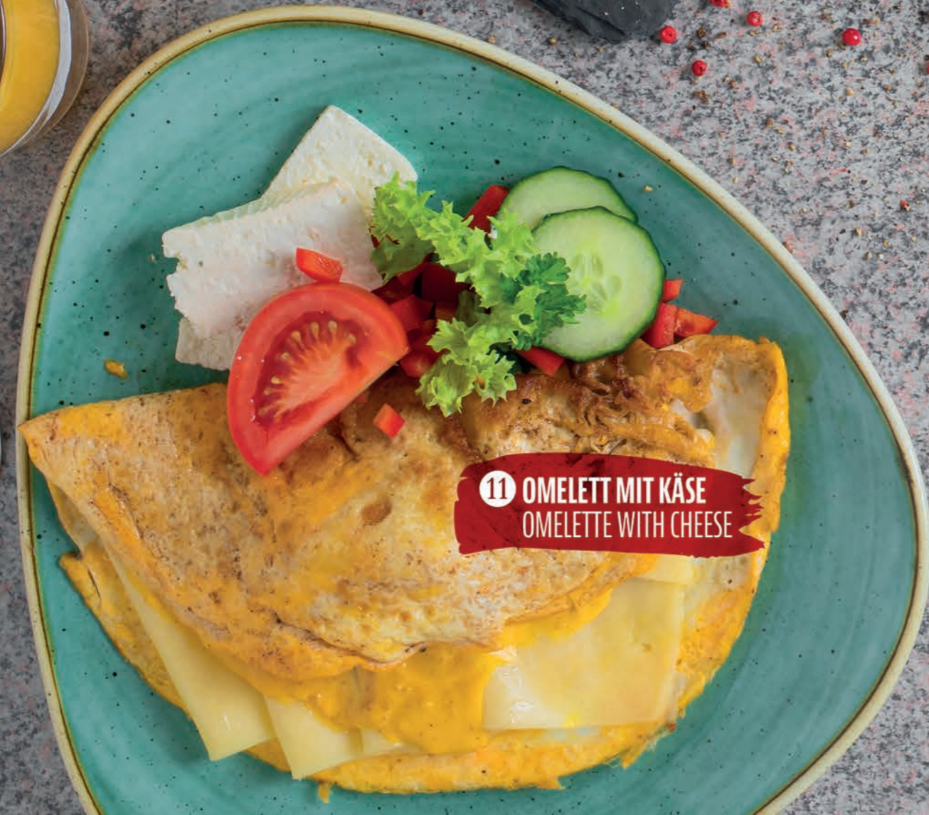
11 OMELETT MIT KÄSE OMELETTE WITH CHEESE