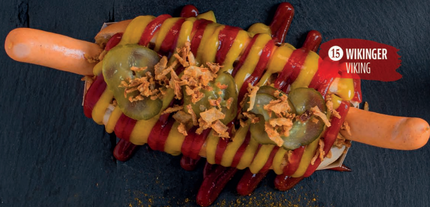
15 WIKINGER VIKING