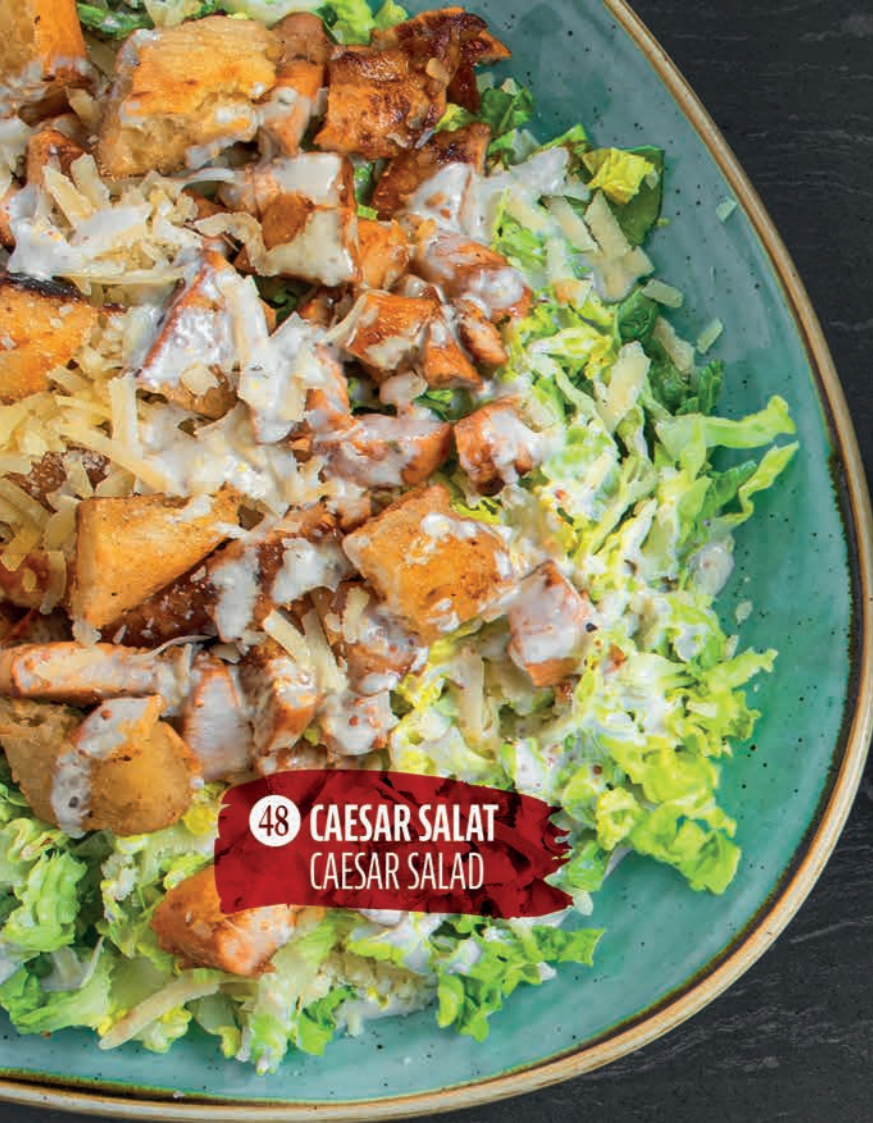
48 CAESAR SALAT CAESAR SALAD