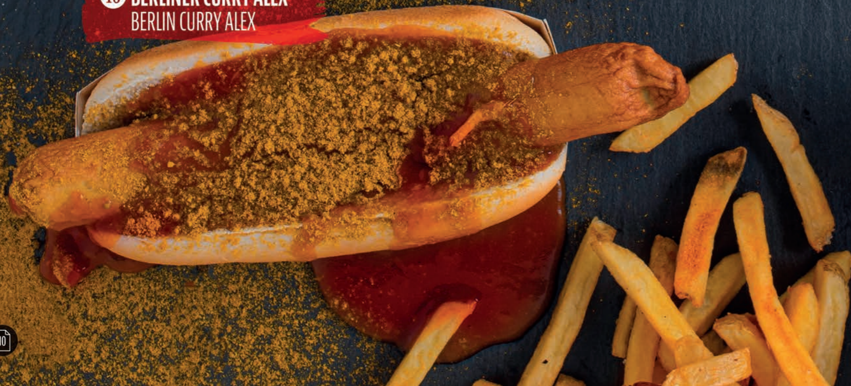
16 BERLINER CURRY ALEX BERLIN CURRY ALEX