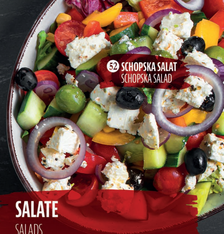
52 SCHOPSKA SALAT SCHOPSKA SALAD